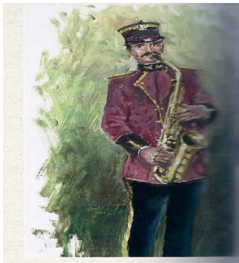
Retrato pintado por Emili Payá y cedido por José María Valls Satorres

fón como son "Variaciones para saxofón" y "Fantasía" de Flaselé. En este sentido, Gasola dio a conocer a los instrumentistas de su banda, obligándolos a ejecutar obras con solistas, tales como: "Variaciones de cornetín" y "Variaciones de flautín". También realizó numerosas adaptaciones para banda y varios bailarines.